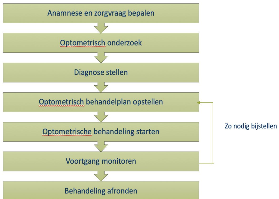
Afbeelding 1: Verdiepend handelen bij methodische aanpak